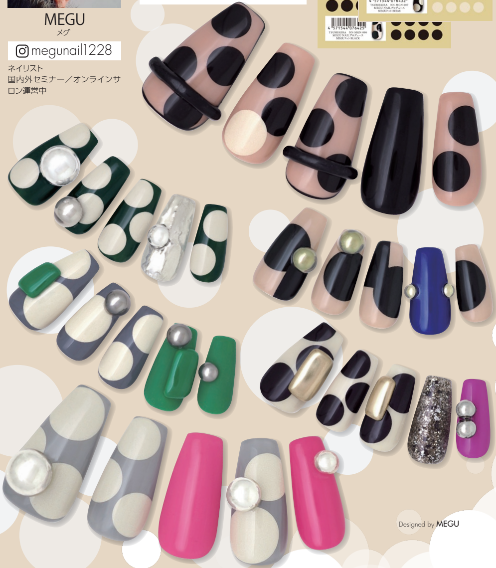
Designed by MEGU