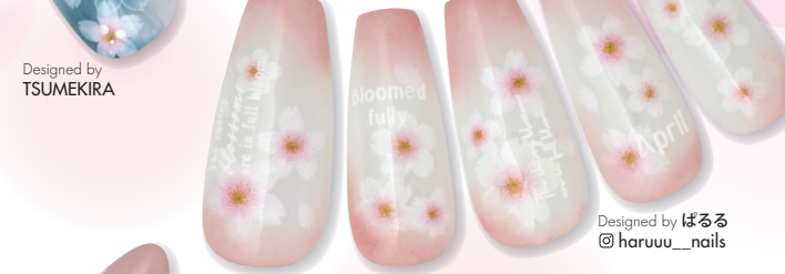
Designed by ぼるる @haruuu_nails