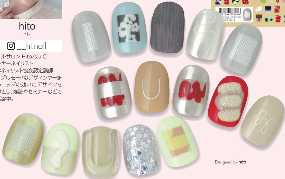
Designed by hito