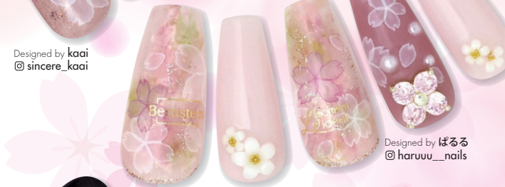
Designed by ぼるる @haruuu_nails