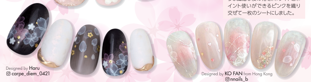
Designed by Haru @carpe_diem_0421