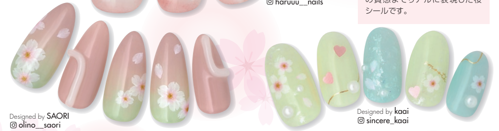
Designed by SAORI @olino_saori