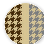
ブラウン・グリー NN-CDR-006