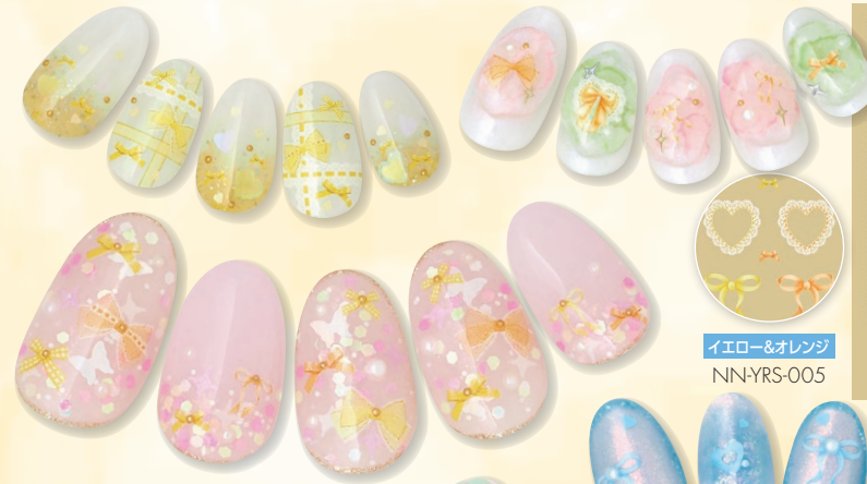
イエロー&オレンジ NN-YRS-005