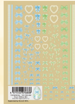
ライトブルー&ライトグリーン NN-YRS-004